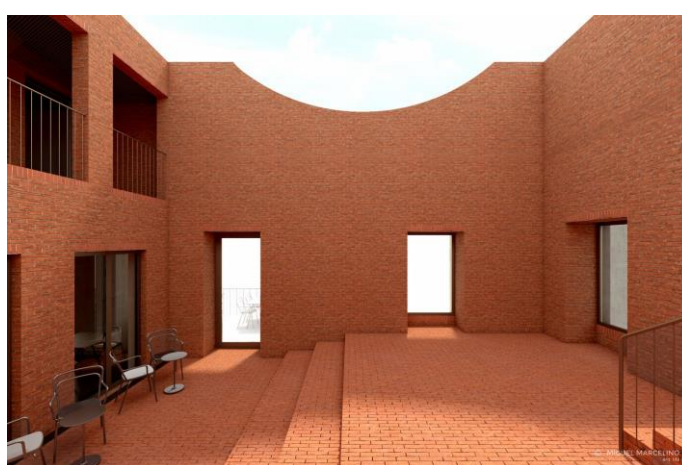
Imagens 5 e 6 – Projeto do Pátio interior