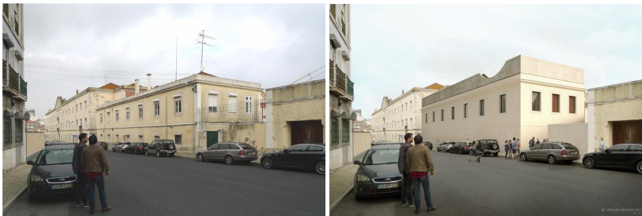
Imagens 1 e 2: Alçados principais da Casa do Capitão antes e depois das Obras

Inserido num antigo complexo industrial de Lisboa em franca transformação, a Casa do Capitão é um lugar não mono funcional. Um espaço de várias valências, facilmente apropriável, pensado para as artes e a cultura. Irá acolher eventos musicais, workshops, livros, gastronomia, residências artísticas e estúdios, entre outros.