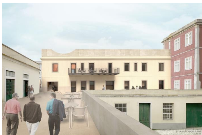
Imagens 3 e 4: Alçados posteriores da Casa do Capitão antes e depois das Obras